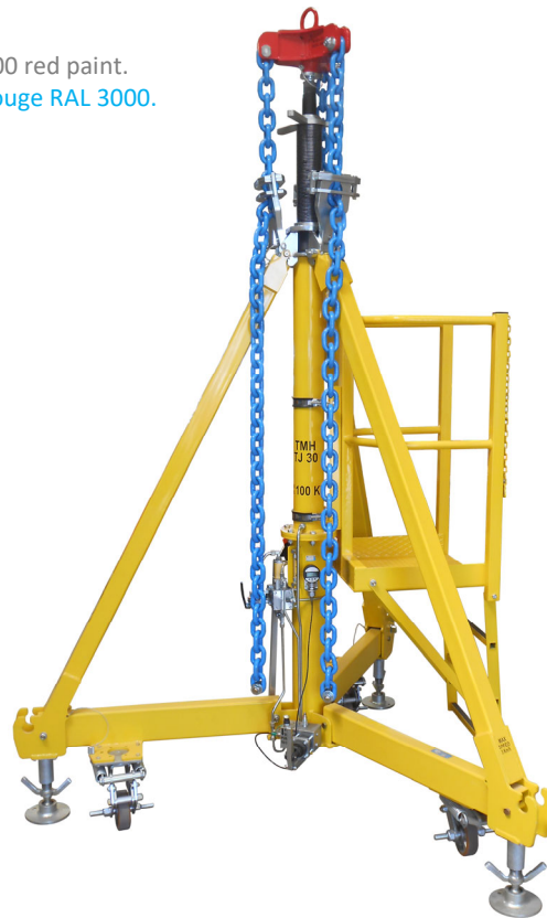
TMH ME94 test tool mounted on TMH TJ tripod serie Outillage d'essai TMH ME94 monté sur la gamme de tripode TMH TJ